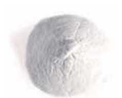
Καθαρό Υπέρλεπτο Λευκό Μάρμαρο από την Carrara